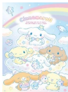
(バースデーデザインシリーズイメージ)