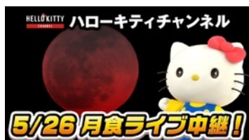
2021年5月に初挑戦したライブ配信