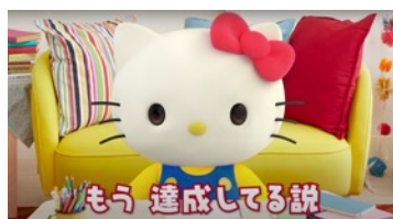
数々の「キティの名言」を生み出した「コメ返」企画

ハローキティは、2018年8月30日から3年間で245本(8月25日現在)の動画を「HELLO KITTY CHANNEL(ハローキティチャンネル)」で配信してきました。視聴者がコメント欄に寄せたメッセージや質問・相談に答える大人気企画「コメント返し」では、キティが大切にしている思いやりと、大きな愛を込めて答えた言葉が度々「キティの名言」とSNSで話題になり、名言をまとめた書籍も発売。最近では、「ライブ配信」や「歌ってみた」などの新しい企画にも挑戦しています。また、「SDGs」を応援する動画も配信しており、2019年からは国連(国際連合)と協働で、「SDGs」への取り組みを紹介する動画シリーズ「#HelloGlobalGoals」をスタートさせ、国連機関のエキスパートに話を聞いたり、海外の難民キャンプや、海の豊かさを守る活動に力を入れている島を訪ねて現地からレポートなどを行っています。