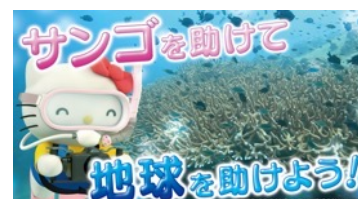
国連と協働で「SDGs」への取り組みを紹介