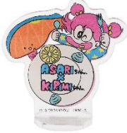
アクリルぶちスタンド(全3種) 各 880 円