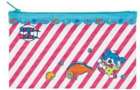
キャラポーチ 1,408 円