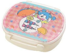
キャラランチボックス 1,320 円