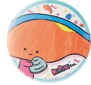
缶バッジ(全3種) 各 528 円