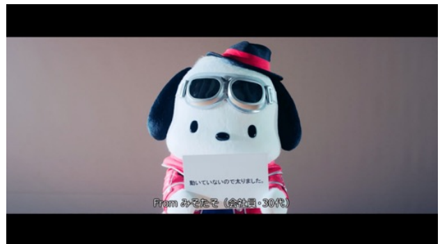
コロナ太りの「もやもやカード」を持つポチャッコ