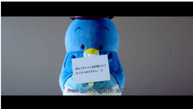
コロナ禍での遠距離恋愛の「もやもやカード」をもつタキシードサム

『ハッピー戦隊★はぴだんぶい』ミュージックビデオURL： https://youtu.be/IB5-cpHs_Xg (9月17日(木)15時公開)