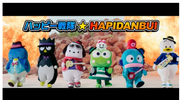
もやもやを解決した勇敢なヒーローたち