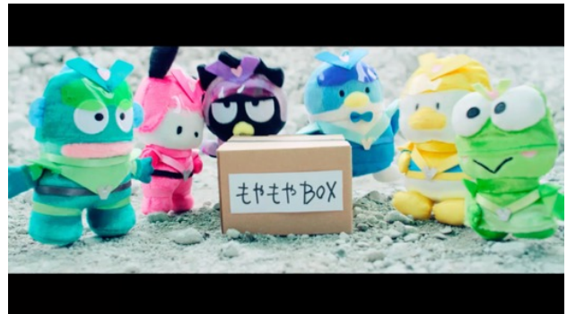
もやもやBOXを運ぶハッピー戦隊「はぴだんぶい」のメンバーたち