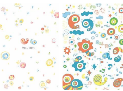
© 1976, 1996, 2001, 2020 SANRIO CO., LTD.