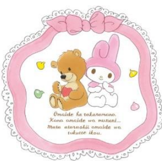
(スイーツデザイン)