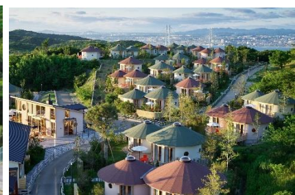
▲GRAND CHARIOT 北斗七星 135°