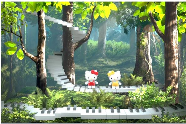
※上記画像はイメージです