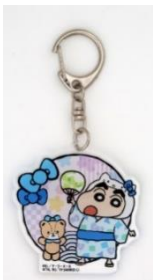
アクリルキーホルダー&缶バッジ 1,200円+税

クレヨンしんちゃんポータルサイト https://www.shinchan-app.jp/