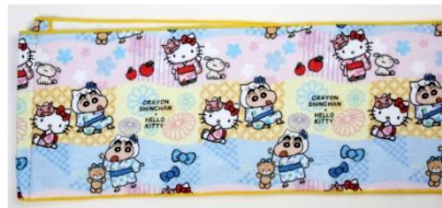
マフラータオル 1,600円+税