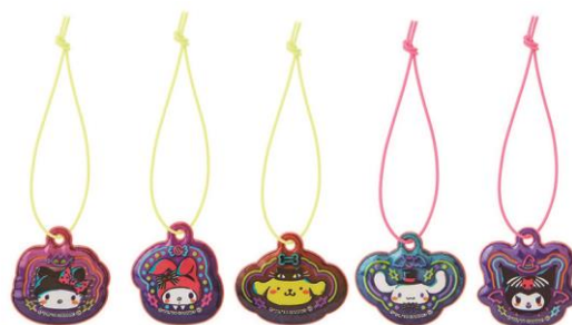
ハロウィーンデザインのマスコット“プレミアム”（全5種）