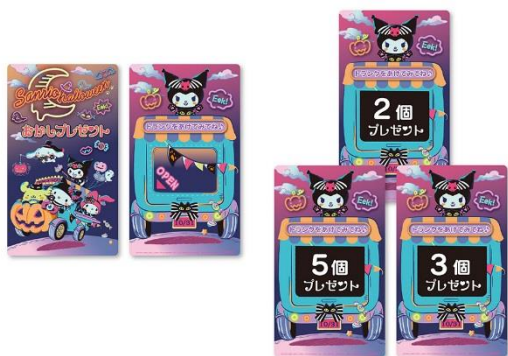
「お菓子プレゼントカード」