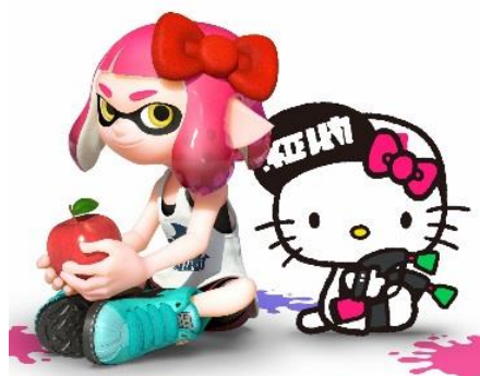
スプラトゥーン 2 × サンリオキャラクターズ

世界累計販売本数 600 万本を超える「スプラトゥーン 2」は、任天堂の家庭用ゲーム機、Nintendo Switch™で遊べるゲームソフトです。4 人対 4 人のチーム戦で地面をインクで塗り合い、時間内により多くの地面を塗ったチームが勝利するアクションシューティングゲームです。今回、期間限定のゲーム内イベントに「ハローキティ」「マイメロディ」「シナモロール」「ポムポムプリン」が登場し、「どっちがかわいい？」をお題にプレイヤーたちがゲーム内で熱いバトルを繰り広げました。