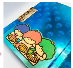
1980年代のバインダー