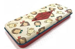
1980年代のペンケース