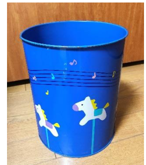
1980年代のルームボックス