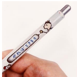
1980年代のシャープペン