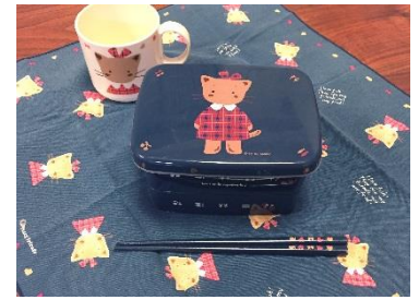
1990年代のランチボックス