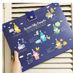
1980年代のハンディケース