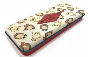
1980年代のペンケース