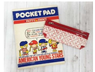
1970年代のノートとペンケース