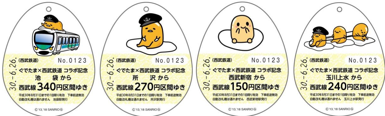
「ぐでたま×西武鉄道コラボ記念乗車券」券面イメージ