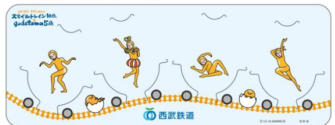
乗車券を外すとこせたまさんが!