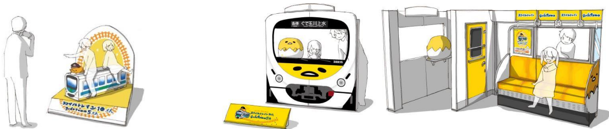
フォトスポット 設置イメージ

※上記の設置に伴い、6月1日（金）～6月4日（月）の期間、玉川上水駅にフォトスポットはございません。