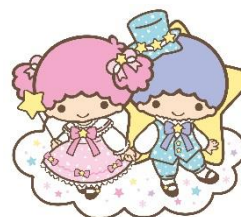
7位 リトルツインスターズ 11,997 票 (6)