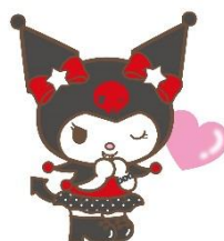
9位 クロミ 6,616票 (11)