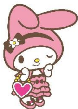
5位 マイメロディ 14,060票 (3)