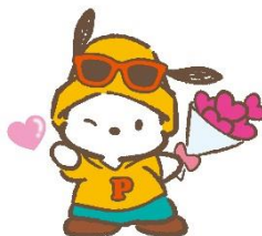
6位 ポチャッコ 12,140 票 (10)