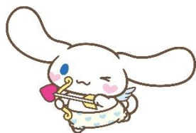
1位 シナモロール 27,715票 (1)