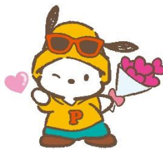
6位 ポチャッコ 12,140票 (10)