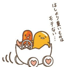
8位 ぐでたま 7,759票 (5)