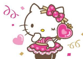
3位 ハローキティ 17,684票 (4)