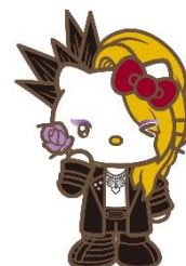
4位 YOSHIKITTY 16,479票 (7)