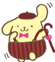
2位 ポムポムプリン 26,707票 (2)