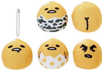
・マスコットセット 2,700円