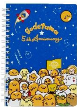
・B6スパイラルノート 648円