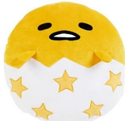
・ダイカットクッション 3,024円