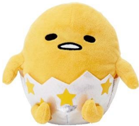
・おしゃべりドール 3,780円

ぐでたまに話しかけると、話しかけたとおりに、動きながらおしゃべります。（最大録音時間：約9秒） ※単4形乾電池3本使用/別売