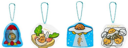
・アクリルキーホルダー（4種類）各648円

透明カバー付きのアクリルキーホルダーです。 ロケット、無重力、UFO、パックの4種類。