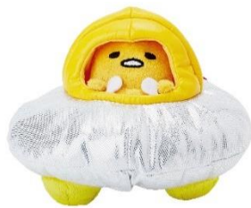
・光るぬいぐるみ 2,160円

ぐでたまに話しかけると、話しかけたとおりに、動きながらおしゃべります。（最大録音時間：約9秒） ※単4形乾電池3本使用/別売