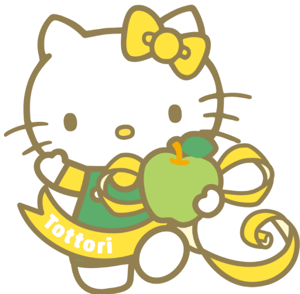
鳥取県 地域限定ハローキティ