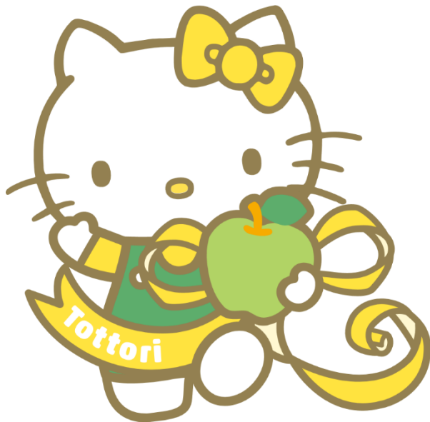
鳥取県 地域限定ハローキティ