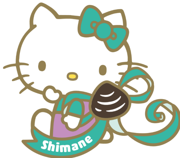
島根県 地域限定ハローキティ