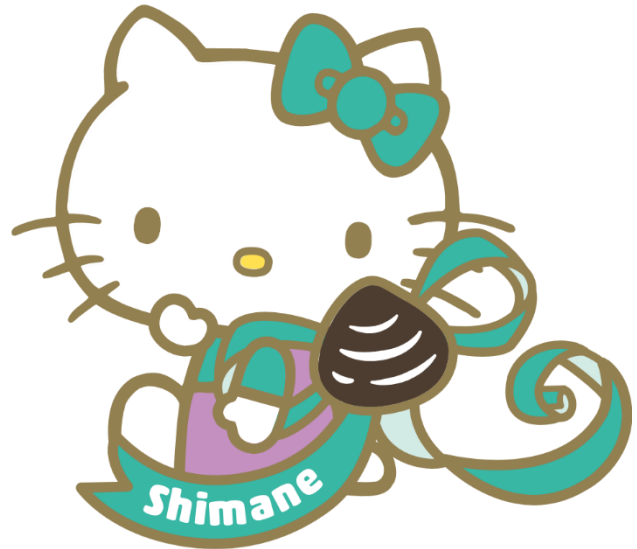
島根県 地域限定ハローキティ