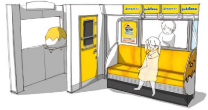
改札内フォトスポット