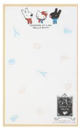
ミニバイダー&メモ 10本 サイズ:バイダー 約横 12.5×縦 20cm メモ 2柄各 15枚入