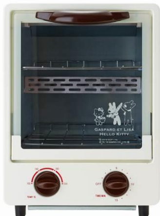
トースター 2本 2段階 サイズ:横 23×縦 31×奥行 26cm