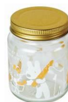
小瓶セット 10本 サイズ:各約直径 6×高さ 7.5cm 3個入り