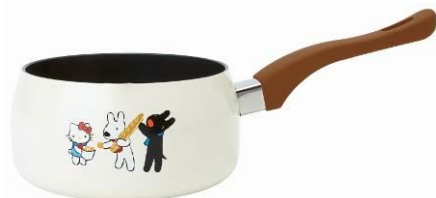
ミルクパン 2本 IH対応の片手鍋 サイズ:約直径 16×高さ 8cm