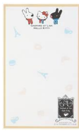
ミニバイダー&メモ 10本 サイズ:バイダー 約横 12.5×縦 20cm メモ 2柄各 15枚入