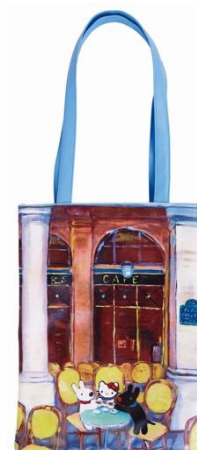
トートバッグA 2本 トートバッグB 2本 リサとガスパール作者とハローキティ担当デザイナー 描き下ろし絵を使用したフラットトート サイズ:約横 28×縦 36cm