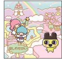
キキとララのふるさと「ほしのせかい」