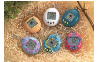
▲1996年 初代「たまごっち」

1996年11月23日に発売し、昨年同日に誕生20周年を迎えた携帯型育成ゲーム「たまごっち」は、1996年の発売から約2年半で全世界にて累計約4,000万個を販売する大ヒット商品となり、社会現象を巻き起こしました。2004年には、「かえってきた!たまごっちプラス」として復活。赤外線通信機能による通信遊びが小学生女子を中心に支持され、「たまごっちプラスシリーズ」以降、全世界で累計約4,100万個以上を販売し、1996年からこれまでに累計8,100万個以上を販売しています(2016年3月末現在)。