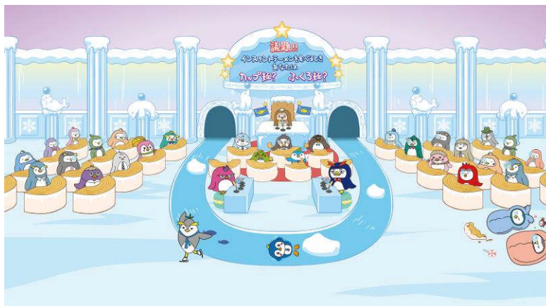
流れるプールがある国会議事堂