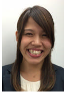
キャラクター名：元気なお 声： テレビ大阪 辰巳 奈穂