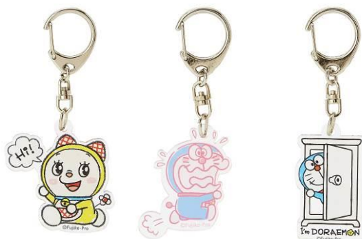
アクリルキーホルダー 各 648円