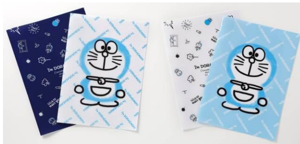
クリアファイル2枚セット 各 486円