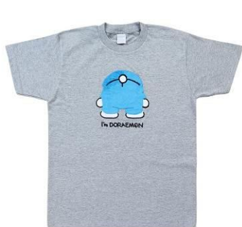
Tシャツ（メンズ） 3,240円 S・M・L