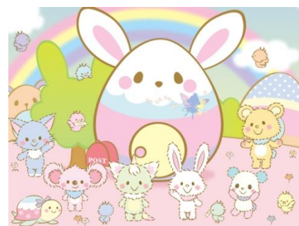
© 2010, 2012 SANRIO CO., LTD.

WEBサイト http://wishmemell.com/ (PC・携帯 共通)