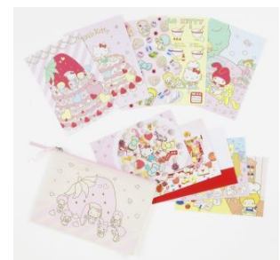
クリアファイルセット(上) 840 円 (税込) ポストカード&フラットポーチセット(下)1,575 円 (税込)