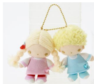
マスコットホルダー 1,890 円 (税込)