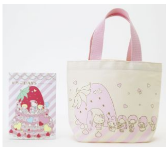
カタログ&トートバッグセット 2,625 円 (税込)

価格帯：クリアファイルセット 840 円 (税込) ~本展覧会のカタログとトートバッグのセット (2,625 円税込)