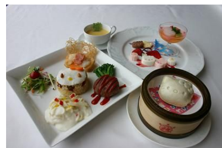
(左) ハローキティのプレートセット