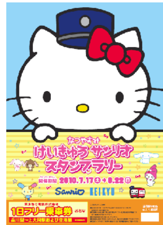
1日フリー乗車券（ラリー帳）イメージ