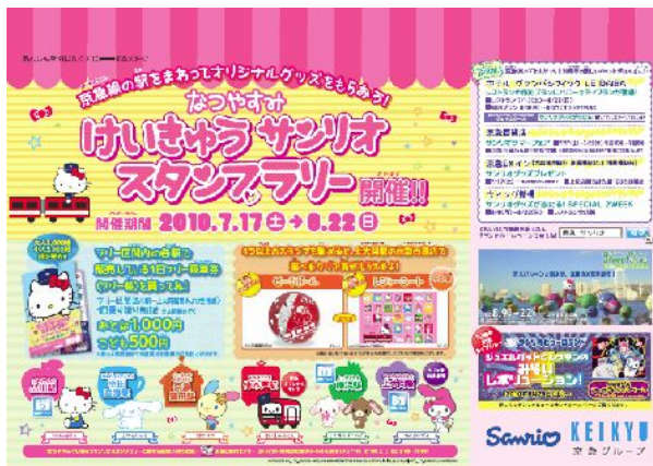
告知ポスターイメージ