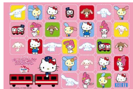
京急オリジナルレジャーシート