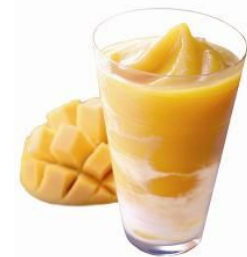
エクセルシオールカフェ プレミアムフローズン「マンゴーパッション&ヨーグルト」 イメージ