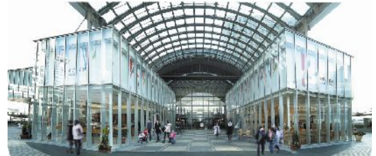
ヴェルエクール(外観)