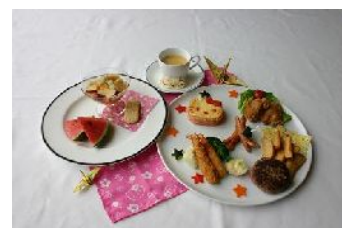
(左) ハローキティスイーツ

※ 上記2店舗において、1日フリー乗車券(ラリー帳)をご提示されたお客様は、エルベット、楼蘭に於けるご飲食代合計10%OFF