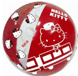
京急オリジナルビーチボール

6駅中4駅のスタンプを集め、京急百貨店5階のサンリオショップに1日フリー乗車券（ラリー帳）をお持ちいただいた方全員にプレゼント。