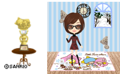
▲(上下)アバターイメージ