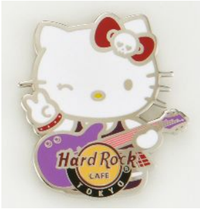
ピンバッジ 1,600 円