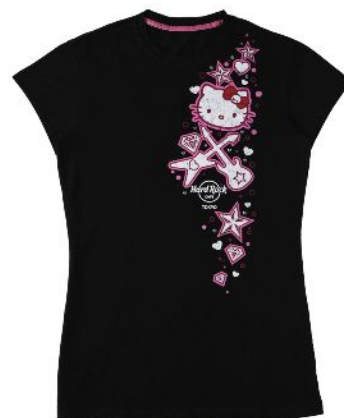
Tシャツ レディース 3,900円 XS・S・M・L・XL