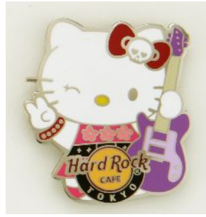
ピンバッジ 1,600 円