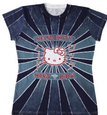
Tシャツ ユニセックス 3,900円 S・M・L・XL