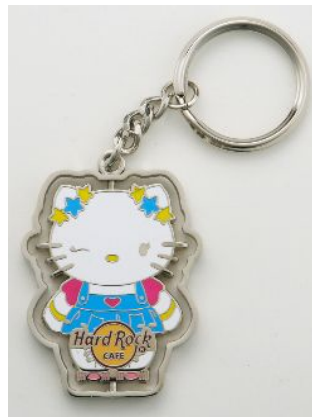
キーチェーン 1,400 円

* Vol.5 (8月15日発売)、Vol.6 (9月15日発売)は画像を掲載しておりません。