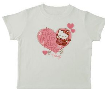
Tシャツ キッズ 3,200円 XS・S・M