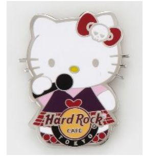
ピンバッジ 1,600 円