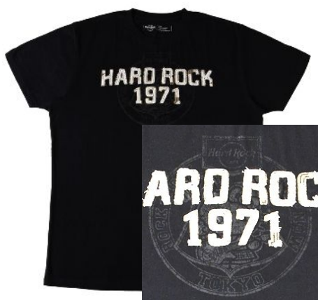
Tシャツ メンズ 3,900円 S・M・L・XL

* 画像は東京店で販売する「TOKYO」の文字がはいったバージョンです。トートバッグとキーチェーン以外は各店別の所在地名が入ります。