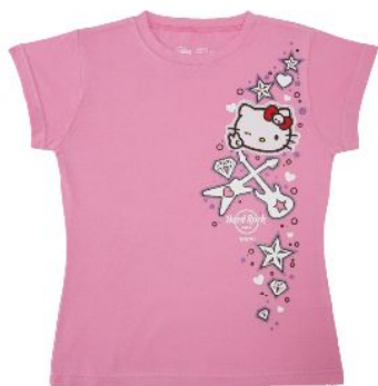
Tシャツ ジュニア 3,200円 XS・S・M・L・XL