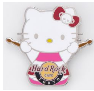
ピンバッジ 1,600 円